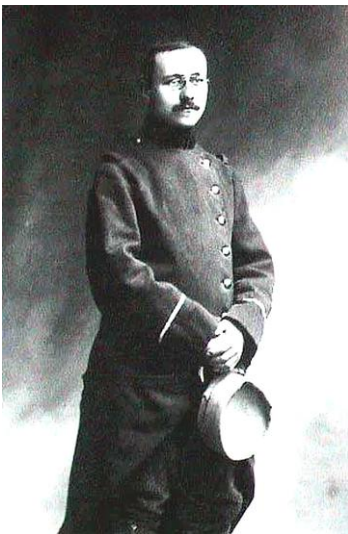
Marc Bloch en uniforme.

Thème Histoire, citoyenneté, esprit critique